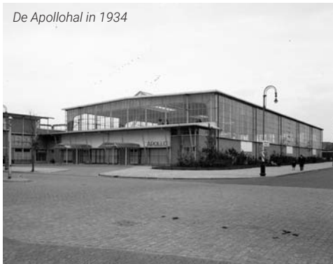
De Apollohal in 1934

De basketbalclub van de AMJV werd in mei 1931 opgericht, als eerste van ons land. De competitie werd daarna ook gespeeld in het AMVJ-pand.