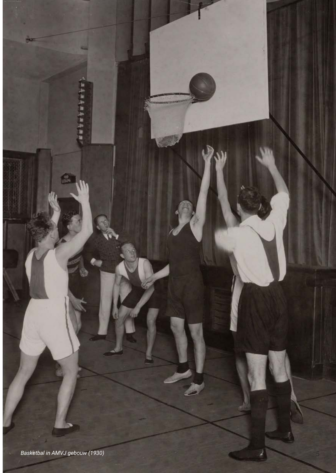
Basketbal in AMVJ gebouw (1930)

Tot ongenoegen van de buurtbewoners bleek de Apollohal in de jaren dertig ook nog eens uitermate geschikt voor massabijeenkomsten van zowel de NSB als de communisten. Er marcheerden daarom regelmatig nationaal-socialisten en communisten door Amsterdam-Zuid, waarmee deze hal de schaduw van de Tweede Wereldoorlog al vooruit wierp. ■