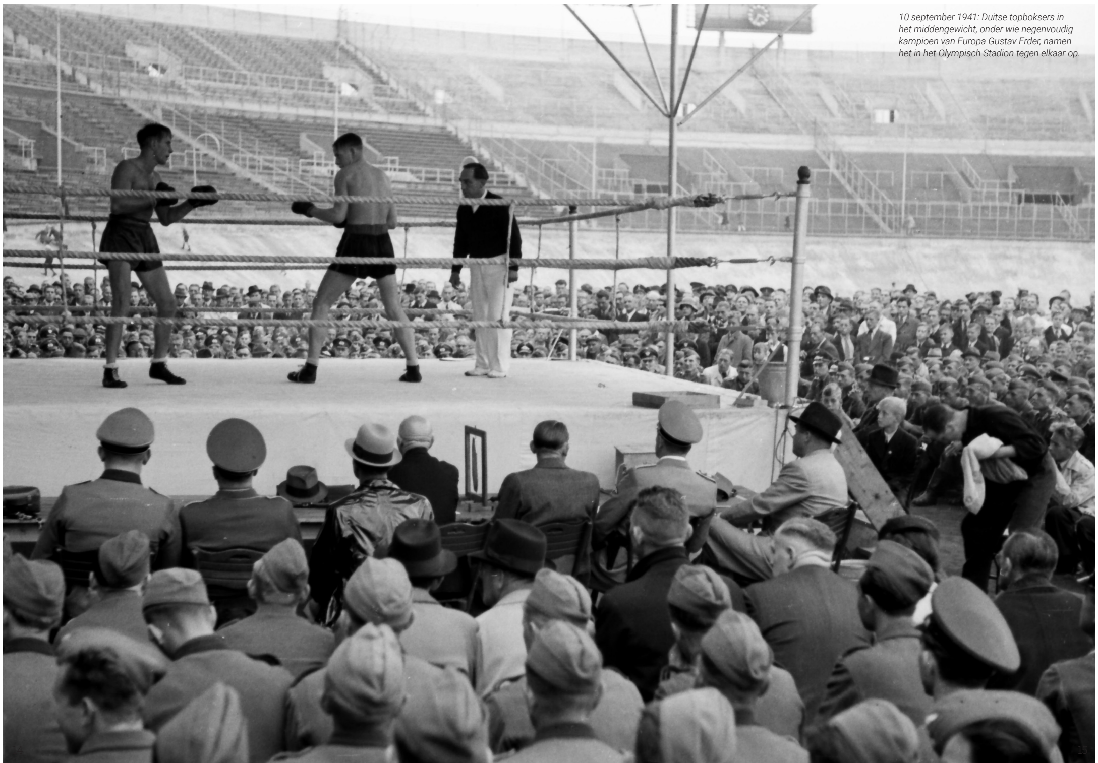
10 september 1941: Duitse topboksers in het middengewicht, onder wie negenvoudig kampioen van Europa Gustav Erder, namen het in het Olympisch Stadion tegen elkaar op.