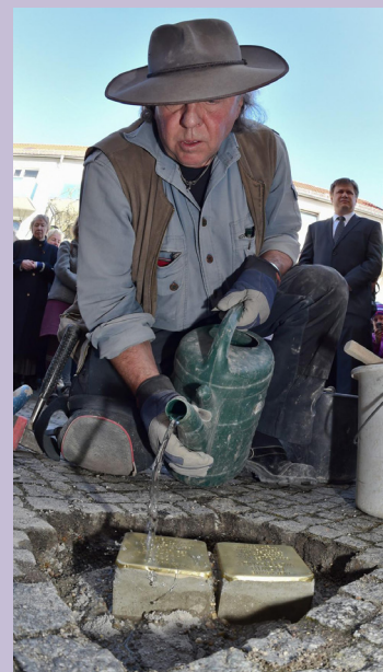
Kunstenaar Gunter Demnig plaatst Stolpersteine.