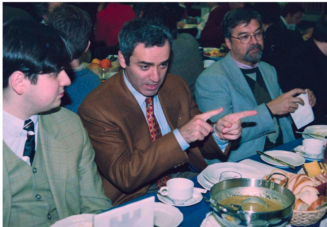
Garri Kasparov in 1999 aan de traditioneel afsluitende toernooimaaltijd tijdens het Hoogoventoernooi (nu: Tata Steel Chess Tournament).

Als er een tekort was aan gas en elektriciteit, belde Mulder hoogstpersoonlijk naar het gasbedrijf om dat probleem op te lossen. "Dan had plotseling heel Beverwijk langer gas en licht voor de schaakgasten," aldus Mulder.