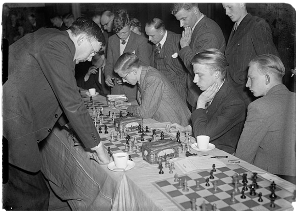
Max Euwe in 1946.

Max Euwe speelde na de Bevrijding in dit Gelderse dorp om geld op te halen voor de nabestaanden.